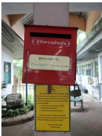
รูปภาพ ๑ กล่องรับความคิดเห็น